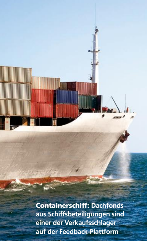
Containershipf: Dachfonds aus Schiffsbeteiligungen sind einer der Verkaufsschlager auf der Feedback-Plattform

Die Hamburger wachsen mit Dienstleistungen rund um den Vertrieb Geschlossener Fonds